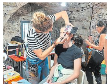
Ein Blick in die „Maske“

Perfekter Tag für zehn „Krone“-Gewinner plus deren Begleiter: Ein Besuch hinter den Kulissen des OperettenSommer-Hits „EVITA“.