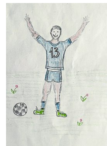
Malien Smekal mit einem jubelnden Fußball-Star.