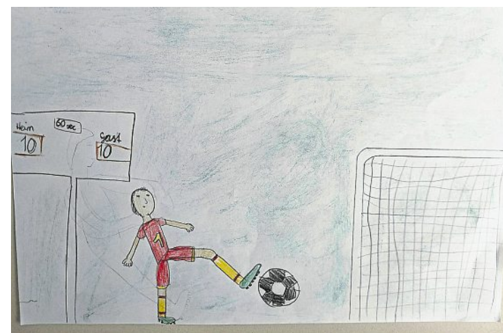
Maja Wieland aus Oberhofen gestaltete einen Fußballer in Rücklage, man beachte den Spielstand auf der Anzeigetafel.